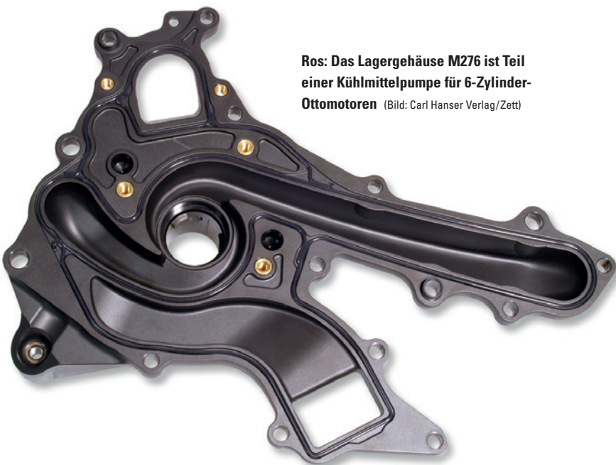
Ros: Das Lagergehäuse M276 ist Teil einer Kühlmittelpumpe für 6-Zylinder-Ottomotoren