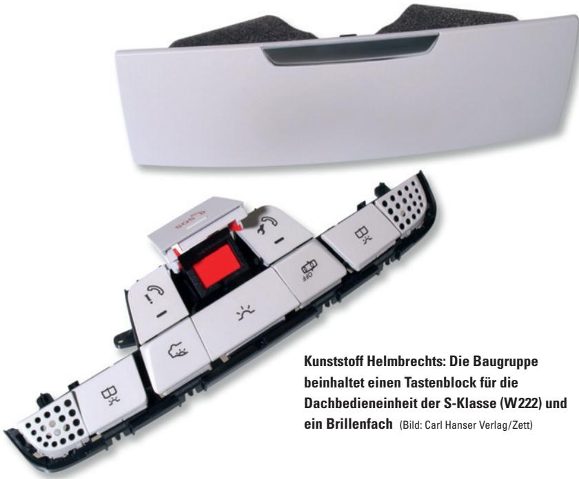
Kunststoff Helmbrechts: Die Baugruppe beinhaltet einen Tastenblock für die Dachbedieneinheit der S-Klasse (W222) und ein Brillenfach

Laut Votum der Jury zeichnen sich die prämierten Produkte durch herausragende konstruktive, fertigungstechnische und kunststoffgerechte Lösungen aus, die es zudem häufig geschafft haben, damit andere Werkstoffe wie z. B. Metalle zu verdrängen. In der Jury sind traditionell je ein Vertreter aus Wissenschaft, Ausbildung, Maschinenbau, Kunststoffherzeugung sowie den Anwenderindustrien versammelt. Dem Gremium gehörten in diesem Jahr an: