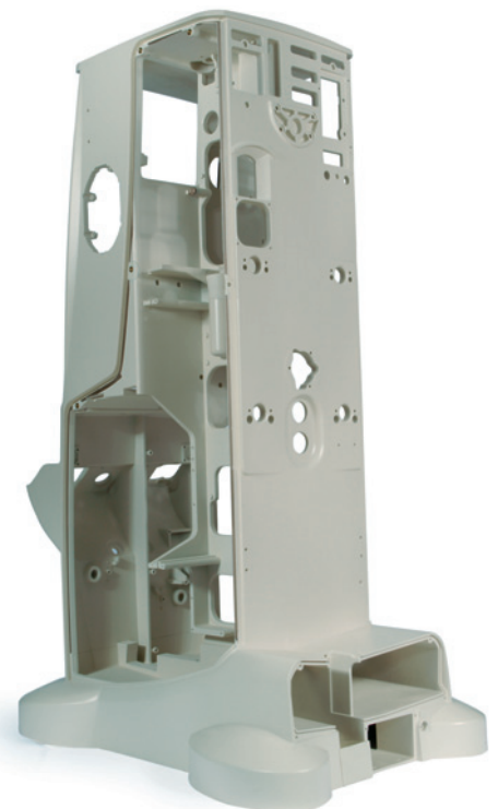
Fried Kunststofftechnik: Das gut 23 kg schwere Gehäuse für ein Dialysegerät wird in einem Schuss im Thermoplast-Schaumspritzgießverfahren hergestellt

Die 120 cm hohen und gut 23 kg schweren Gehäuse werden in einem Schuss aus einem flammgeschützten PS gefertigt und anschließend in der hausei-