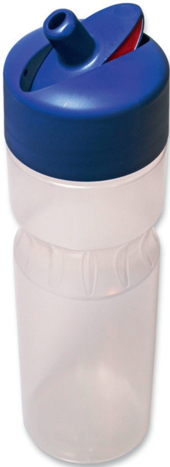
Adoma: Ein neuartiger Flaschenverschluss mit Kippgelenk schützt Trinknippel und Flascheninhalt zuverlässig vor Verschmutzung