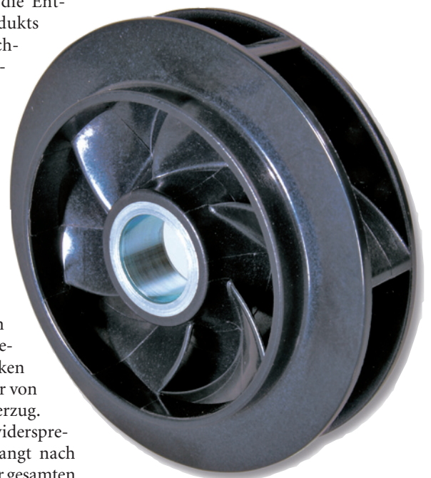
Ros: VW setzt das Flügelrad 04E in seinen 1,2- und 1,4-Liter-Motoren ein

Die Problemstellung lautete in diesem Fall, ein Flügelrad zu entwickeln, das eine hohe Förderleistung und, damit verbunden, einen hohen Wirkungsgrad aufweist und sich gleichzeitig durch – bezogen auf Außendurchmesser und Bauteilhöhe – sehr geringe Abmessungen auszeichnet. Die geometrische Konstruktion entstand in enger Zusammenarbeit zwischen Kunststoffverarbeiter und Auftraggeber. Der Herstellprozess wurde so ausgelegt, dass die Rundheit des Bauteils gewährleistet ist. Um die extremen Hinterschnitte am Bauteil entformen zu können, wurden innovative Werkzeugtechniken eingesetzt. →