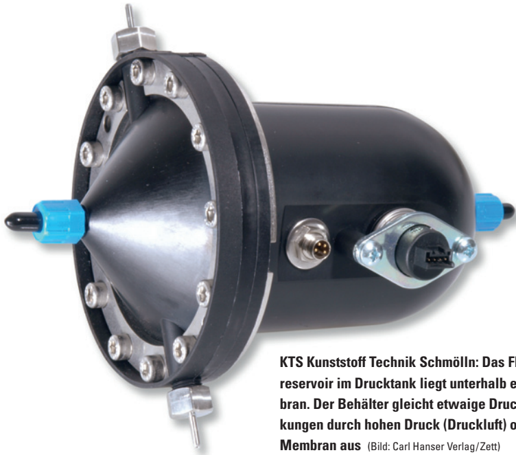
KTS Kunststoff Technik Schmölln: Das Flüssigkeitsreservoir im Drucktank liegt unterhalb einer Membran. Der Behälter gleicht etwaige Druckschwankungen durch hohen Druck (Druckluft) oberhalb der Membran aus

dehnung ab. Tauchen sie in den Gegenkern ein, gibt es allein durch die Temperierung des Werkzeugs einen leichten Versatz von 0,01 bis 0,02 mm, und der kleine Kern bekommt bei jedem Schuss eine seitliche Belastung, bis er bricht.